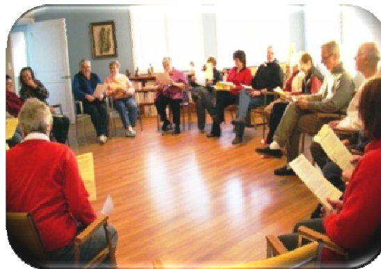
La salle de conférence peut accueillir de 25 à 30 personnes.

Le Centre Lumière des Prairies vous conviendra sûrement.