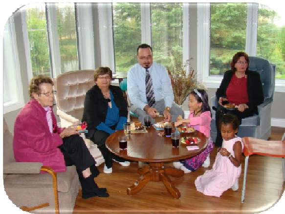
Là où il y a l'amour, la lumière jaillit.

Le Centre Lumière des Prairies, fondé sur les valeurs de l'amour, la confiance et la bonté, offre un endroit accueillant et rassurant à toute personne en quête de sens, d'harmonie intérieure et de plénitude.