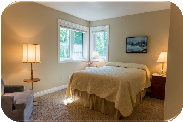
Chambres privées à prix abordable