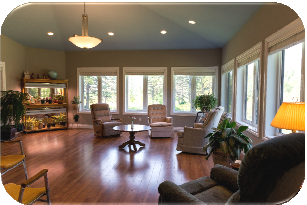
La Salle Soleil peut accueillir 20 personnes.