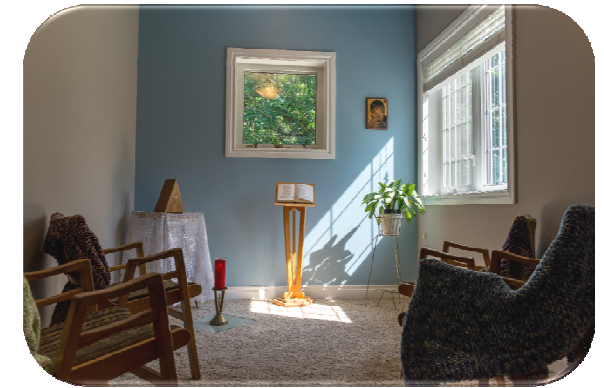
Lieu intime permettant la réflexion, la méditation ou la prière