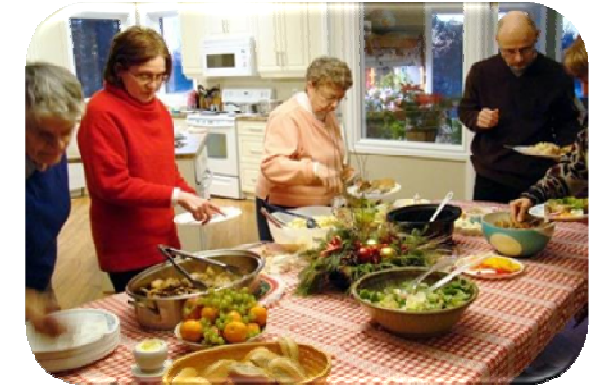
Cuisine 'maison' simple et nourrissante